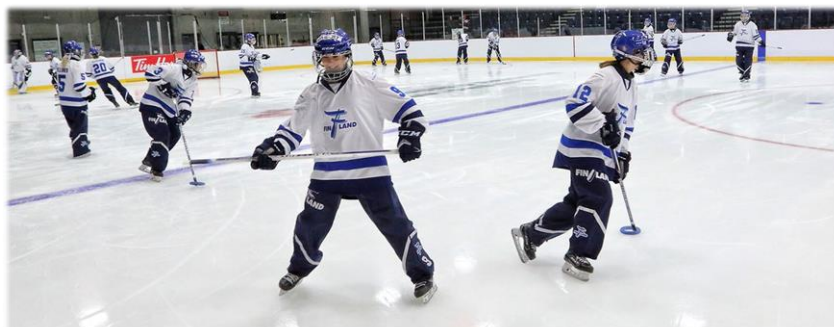
Kuva: U21 (Andre Vandal)

U18 toiminnan puitteissa järjestetään myös vanhemman C-ikäluokan pelaajille tarkoitettu Timanttileiri, joka aloittaa pelaajan maajoukkuepolun. Pelaajat tulevat tälle leirille seurojen esitysten pohjalta. Vuonna 2005 syntyneiden Timanttileiri pystyttiin pitämään Kisakallion Urheiluopistolla elokuussa ja sille osallistui seurojen esittäminä 59 nuorta pelaajaa.