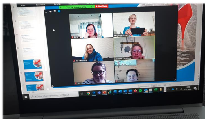
Kuva: Webinaari (Merja Markkanen)

Näiden webinaarien lisäksi keväällä järjestettiin aikuisten harrastetoiminnasta kiinnostuneille seuroille kolme aikuisten luistelu- ja ringettekoulun tuotteistamiseen liittyvää verkkotyöpajaa.