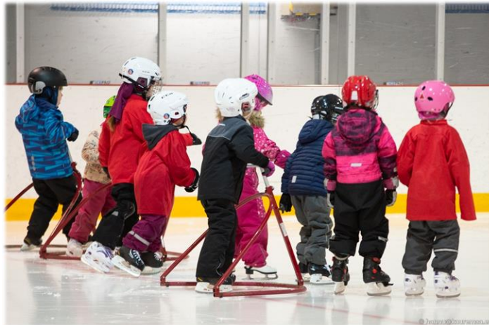
Kuva: Luisteluopetusta Ringetteviikolla (Hannu Kauremaa)

Ringetteviikolla seurat järjestivät oman seuran henkeä ja yhteisöllisyyttä kasvattavia tapahtumia omille harrastajilleen. Seuroja kannustettiin olemaan yhteydessä myös seuran entisiin pelaajiin ja järjestämään heille toimintaa esim. kutsumalla heidät seuraamaan seuran edustusjoukkueen peliä. Tavoitteena on tarjota entisille pelaajille mahdollisuutta palata takaisin lajin pariin joko harrastajaksi tai seuratoimijaksi.